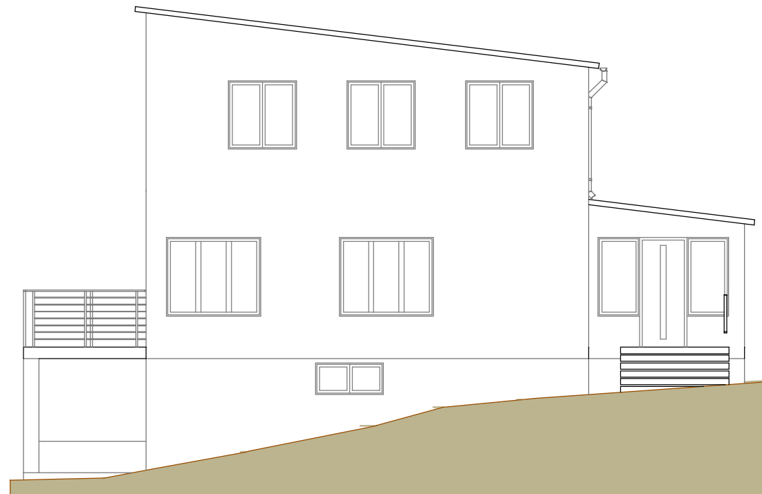
fasad mot öster