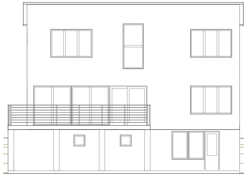
fasad mot söder